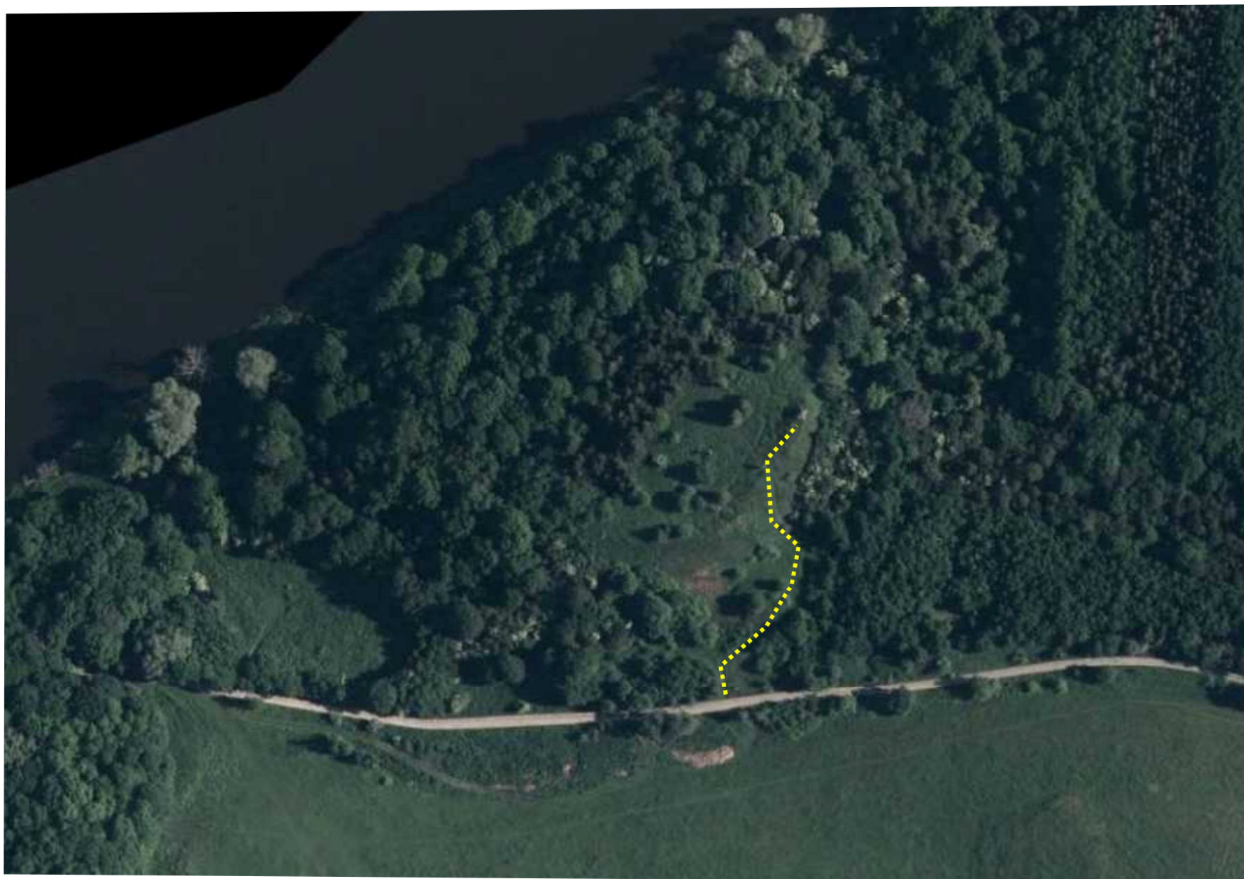
Ryc.5. Obiekt Raduń. Żółta, przerywana linia – ścieżka przyrodnicza.