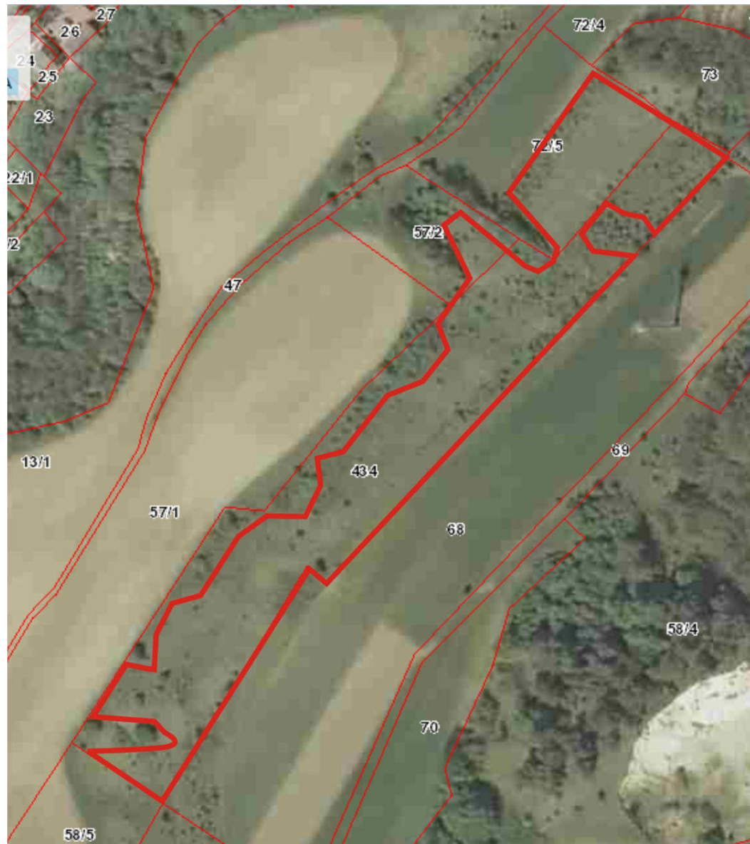
Ryc.4. Obiekt Krajnik Dolny. Czerwona, ciągła linia – powierzchnia przeznaczona do wykoszenia niedojadów lub wycięcia krzewów.