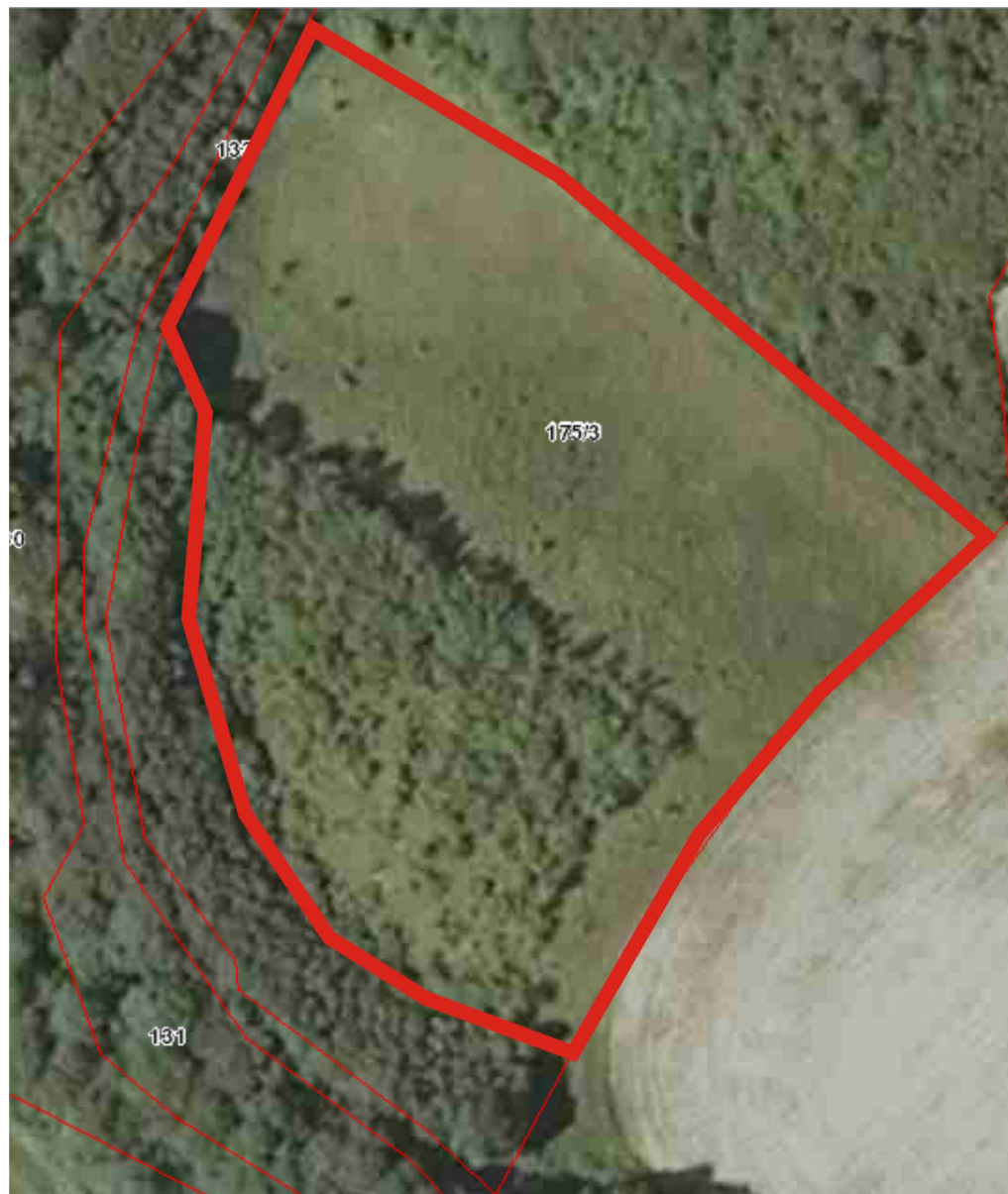
Ryc.3. Obiekt Zatoń Dolna. Czerwona, ciągła linia – powierzchnia przeznaczona do wykoszenia niedojadów lub wycięcia krzewów.