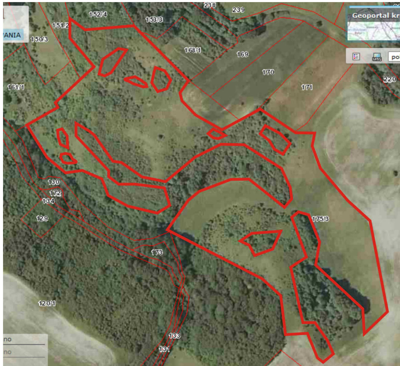
Ryc.2. Obiekt Zatoń Dolna. Czerwona, ciągła linia – powierzchnia przeznaczona do wykoszenia niedojadów lub wycięcia krzewów.